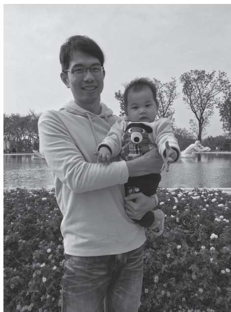
◎ 爸爸共同負擔照顧的成本才能完善照顧體制

所以，與其說托育政策是為了提高生育率，不如說是為了落實養育責任的均等。福利國家存