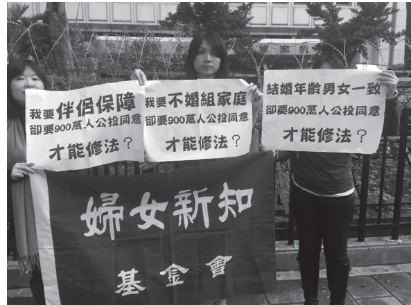
◎婦女新知基金會工作室人員帶標語至會場抗議，標語凸顯此公投案的荒謬

公投案主文並未具體指明「涉及夫妻、血緣與人倫關係的規定」為哪些條文，易招致誤解，致人民各自認知所涉具體條文有別，無從就公投題目做出正確同意與否的決定。且其內容所涉既非單一事項，卻要民眾表示同意與否，為邏輯上複合問句謬誤，本會認為本公投案內容具備明顯錯誤，符合第十四條第一項第四款，「提案內容相互矛盾或顯有錯誤，致不能瞭解其提案真意」。