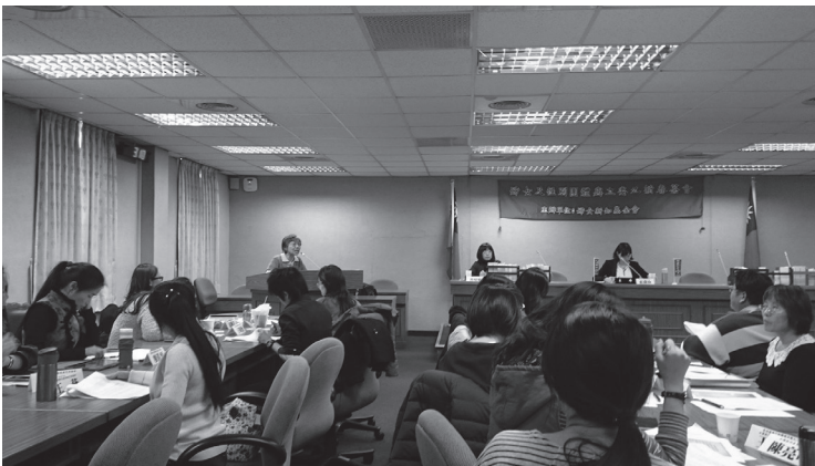
◎婦女新知邀請友好團體與新任立委進行交流座談，討論各團體的政策主張

今年(2016年)1月16日選舉結果，國會結構大幅改變，民進黨首次拿下國會過半，立法院出現四個黨團，新立委出現更多的社運背景人士；女性立委比例再創新高，從上屆佔33%升至本屆38%。