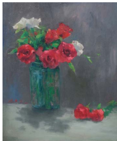
玫瑰 | 油畫 46X38cm 2010 年