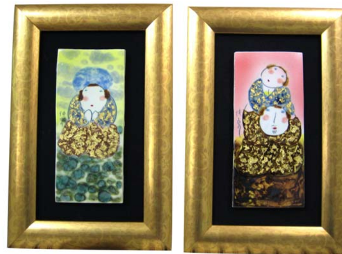
願 / 我和妳 | 瓷·金 26X12cm 2011 年