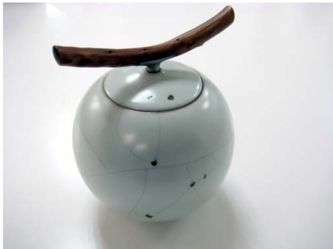
原木滿釉正把壺 | 陶·木·不鏽鋼