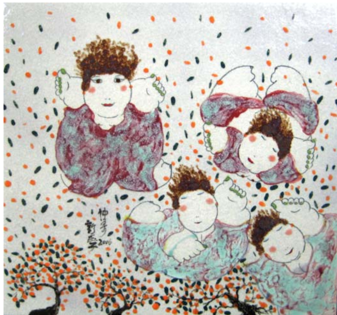
愛在飛翔 | 瓷 42X39.5cm 2006 年