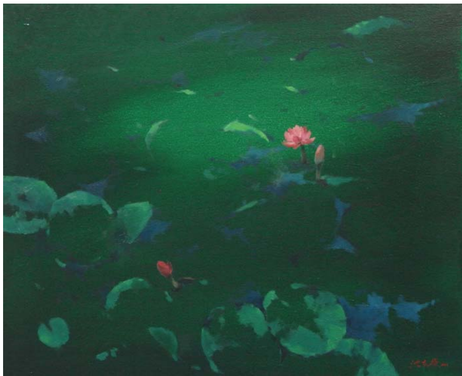
暗香 | 油畫 61X50cm 2011 年